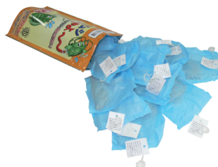
分包タイプ お徳用