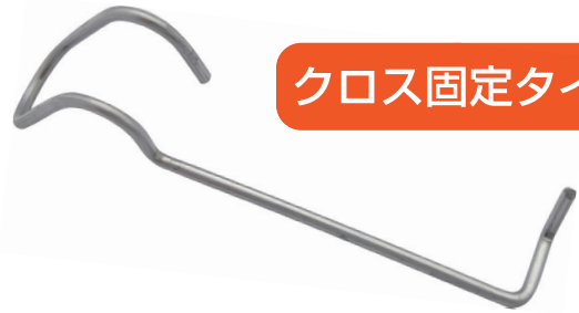
クロス固定タイプ