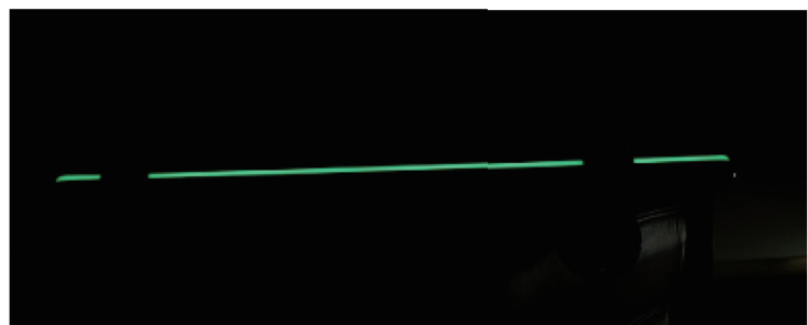
夜間や暗闇で蓄光ラインが光り、手すりの位置がすぐにわかります。