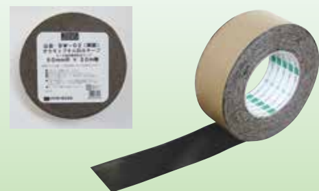
BW-02 防水プチルテープ(両面テープ) NYG協会推奨品