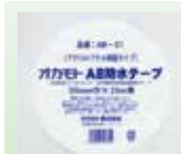
AB-01 AB防水テープ NYG協会推奨品