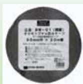
BW-01 防水プチルテープ(両面タイプ) NYG協会推奨品