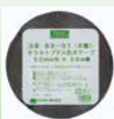
BS-01 防水プチルテープ(片面タイプ)