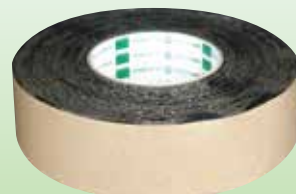
No.545 プチル両面テープ