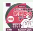
AW-02 アクリル 気密防水テープ (両面タイプ) NYG協会推奨品