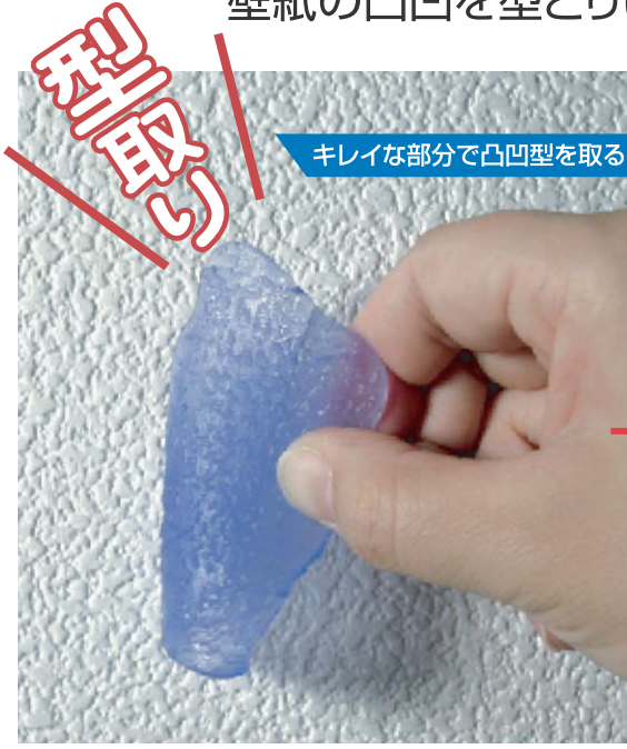
キレイな部分で凸凹型を取る