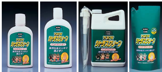
235ml 470ml 1.9L 詰め替え用 1.2L