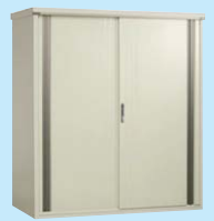
ホワイトパールマイカ(WM)