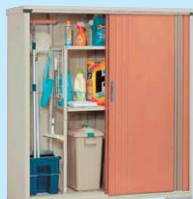
トロピカルオレンジ(WT)