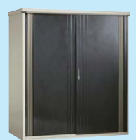
ブラックパールマイカ(KM)