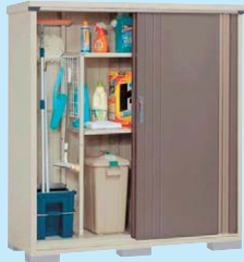
カーボンブラウン(WB)