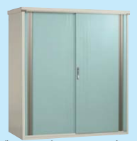
グリーンパールマイカ(GM)