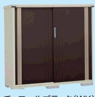
チョコレートブラック(WK)