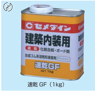
速乾 GF (1kg)