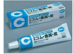
速乾 G クリア

建築内装 化粧合板・ボード類用 JIS A 5538 F☆☆☆☆表示品 (速乾 G クリア:透明タイプ JIS A 5549 F☆☆☆☆表示品) 4VOC基準適合