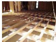
ネダ組付用 EM 346