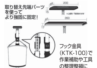
取り替え先端パーツを使ってより強固に固定!