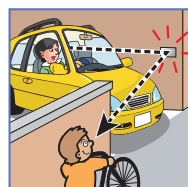
車が出るときの 安全確認に!