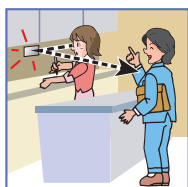
店舗などでの 来客の確認!