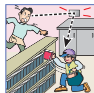
店舗内での万引 き防止に!