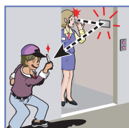
エレベータでの 防犯に!