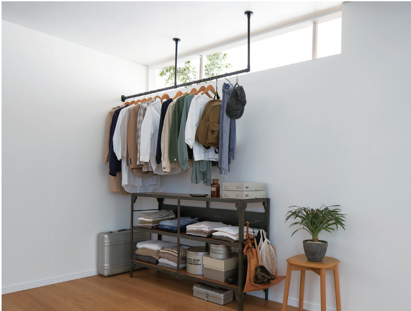
ハンギングバー H-1 ブラック 天井付Lタイプ W1500mm×H450mm 壁面からハンギングバーまで250mm 天井高さ2400mm 詳細 P.434 ハンギングバー