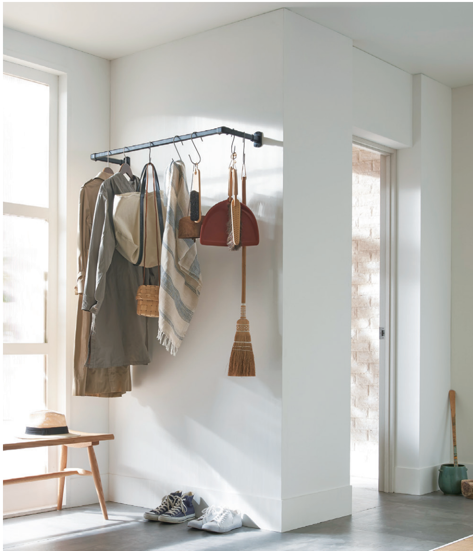
ハンギングバー H-1 ブラック 正面付Cタイプ W900mm×D250mm 床からハンギングバーまでの高さ1800mm 詳細 P.434 ハンギングバー

玄関にハンギングバーを設置すれば、花粉やホコリのついた上着などを部屋の中に持ち込まず掛けておくことができます。