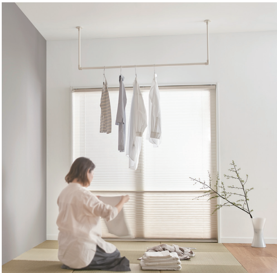
ハンギングバー H-1 ホワイト 天井付Cタイプ W1400mm×H450mm 壁面からハンギングバーまで600mm 天井高さ2400mm 詳細 P.434 ハンギングバー

リビング横にある畳コーナーに設置すれば、洗濯物が乾いたあと、そのまま畳の上でたたむことができ、家事もしやすくなります。