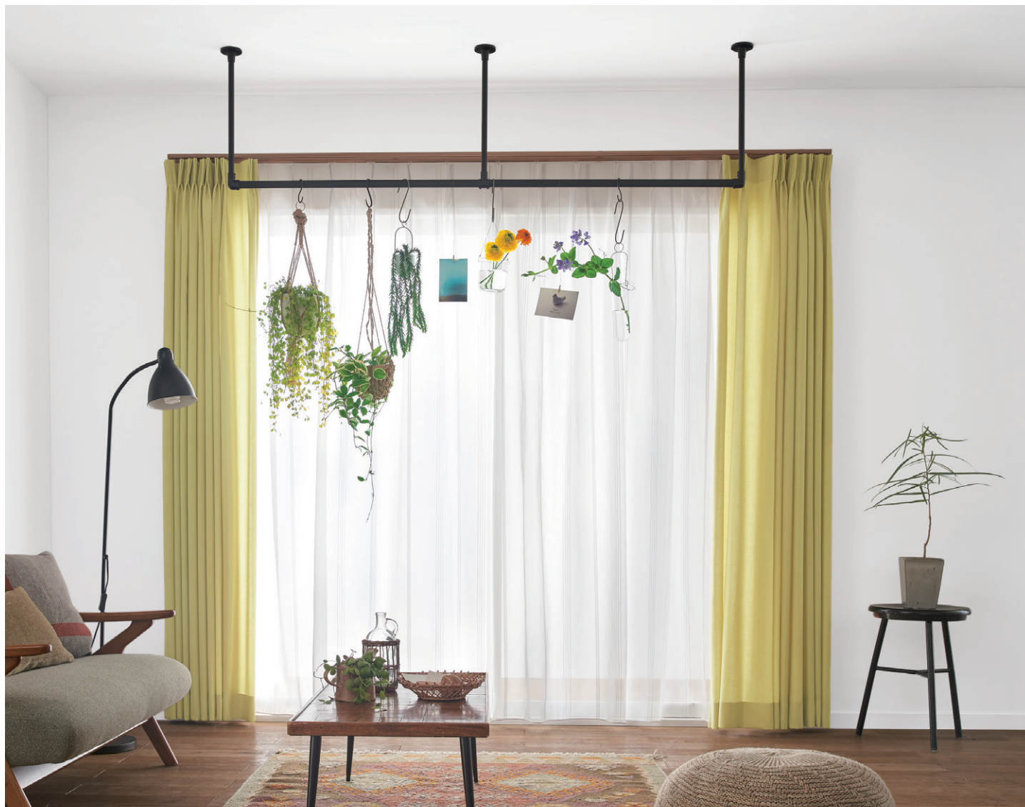
ハンギングバー H-1 ブラック 天井付Cタイプ W1500mm×H450mm 壁面からハンギングバーまで600mm 天井高さ2400mm 詳細 P.434 ハンギングバー

来客があるときには、グリーンや小物を飾るディスプレイハンギングとして楽しめます。