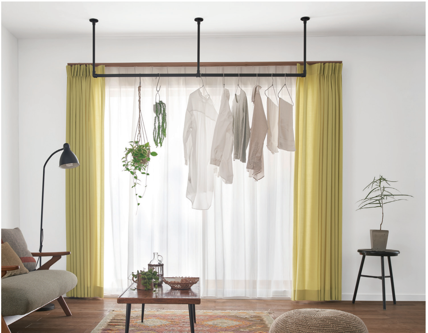
ハンギングバー H-1 ブラック 天井付Cタイプ W1500mm×H450mm 壁面からハンギングバーまで600mm 天井高さ2400mm 詳細 P.434 ハンギングバー

スマートなデザインのハンギングバー。 洗濯物などを掛ける実用性と、グリーンなど飾るものを引き立てる高いインテリア性を兼ね備えています。