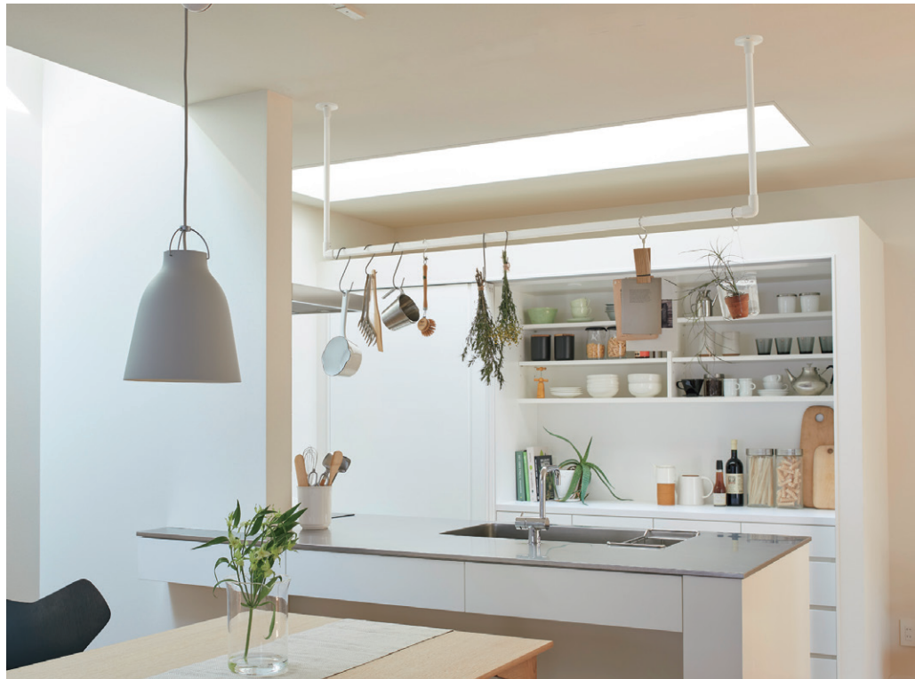
ハンギングバー H-1 ホワイト 天井付Cタイプ W1400mm×H450mm 天井高さ2400mm 詳細 P.434 ハンギングバー

対面キッチンの上に設置したハンギングバーには、ドライハーブやグリーン、レシピなどを掛けて明るく楽しい空間へ。キッチンツールも一緒に掛ければ実用性もアップします。