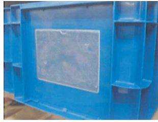
プラコンにクリアファイルを貼りつける。