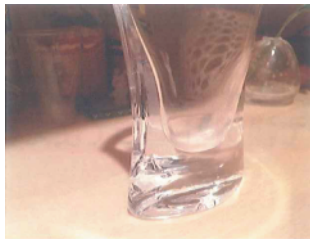
花瓶の転倒防止に。