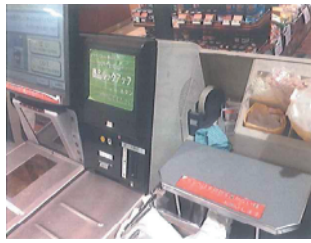
注意書き等をしっかり貼れて、きれいにはがせる