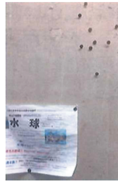
画紙が落ちると危険な場合、画紙のかわりに使用。