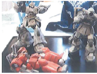
模型など小物の固定に。透明なので目立ちにくく移動も可能。