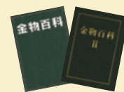
総合カタログ 金物百科