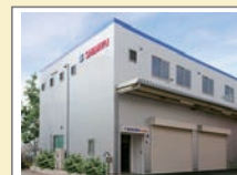
名古屋支店 新社屋