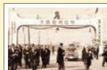
東大阪金物団地着工(1967年)