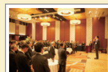
創業70周年記念 「感謝の集い」