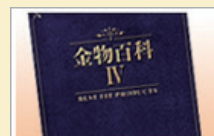
総合カタログ「金物百科IV」