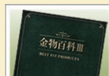
総合カタログ「金物百科III」