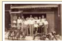
大阪市南区 旧本社前(1951年)

1997年 ・創業50周年記念式典挙行 ・創業50周年記念社員海外旅行実施 ・新社歌未来(あす)を創ろう」 (作詞/島田陽子 作曲/塩崎 洋)制作発表