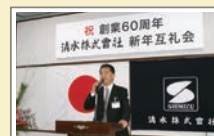
創業60周年記念新年互礼会