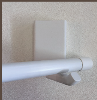
使用時 (物干し竿を乗せます)