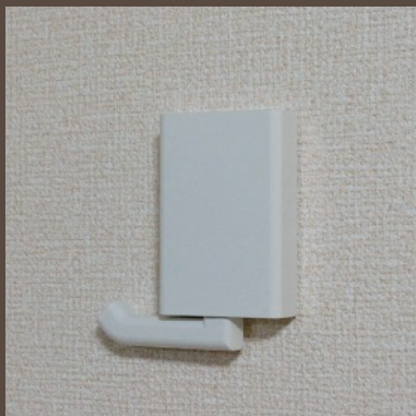
不使用時 (フックをたためます)