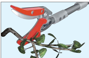
切ってつかめるカットキャッチ機能